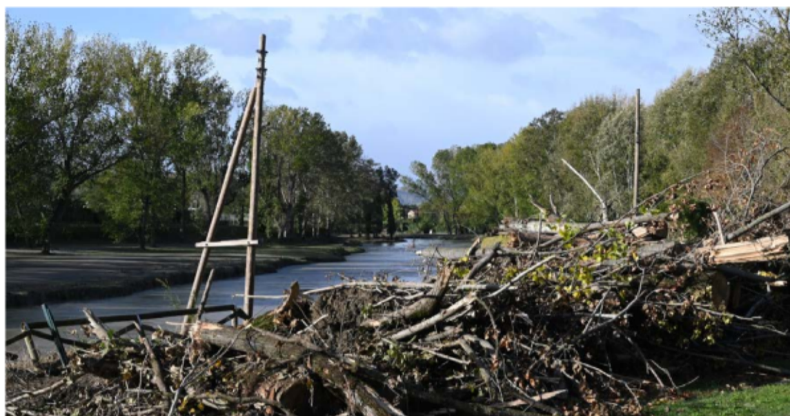
Sopra e sotto, allagamenti e danni provocati dal maltempo dell'autunno scorso nell'imolese